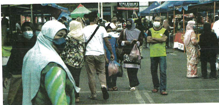
PENGUNJUNG memakai pelitup muka semasa tinjauan di Pasar Tani UTC, Kuantan.

Bagi memastikan proses pengundian berjalan lancar dan selamat terutamanya bagi mengurangkan risiko penularan jangkitan, Dr Noor Hisham berkata pengundi positif Covid-19 perlu mematuhi penjarakan fi-