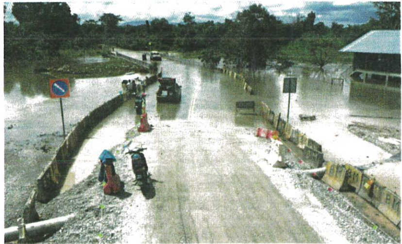
Tinjauan laluan ke Jalan Kampung Gual To' Deh, Rantau Panjang ditutup akibat banjir.